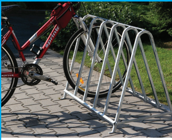
Stojan typu A: