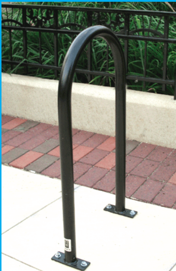
Stojan typu U: