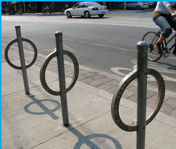
Stojan s kruhom: