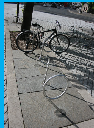
Tzv. Viedeňský stojan: