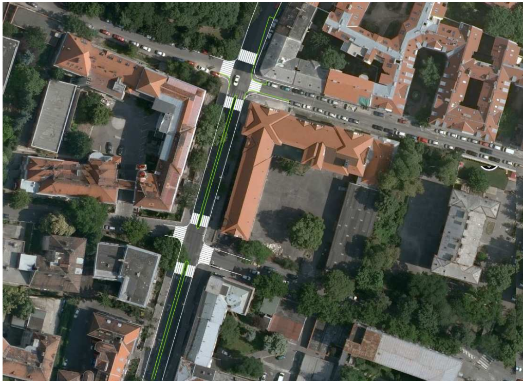
Partizánska - situácia