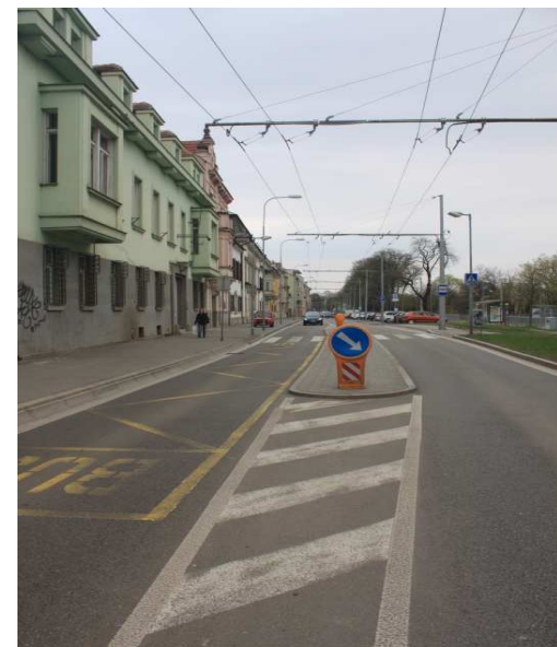
Brno - riešenie obdobnej situácie