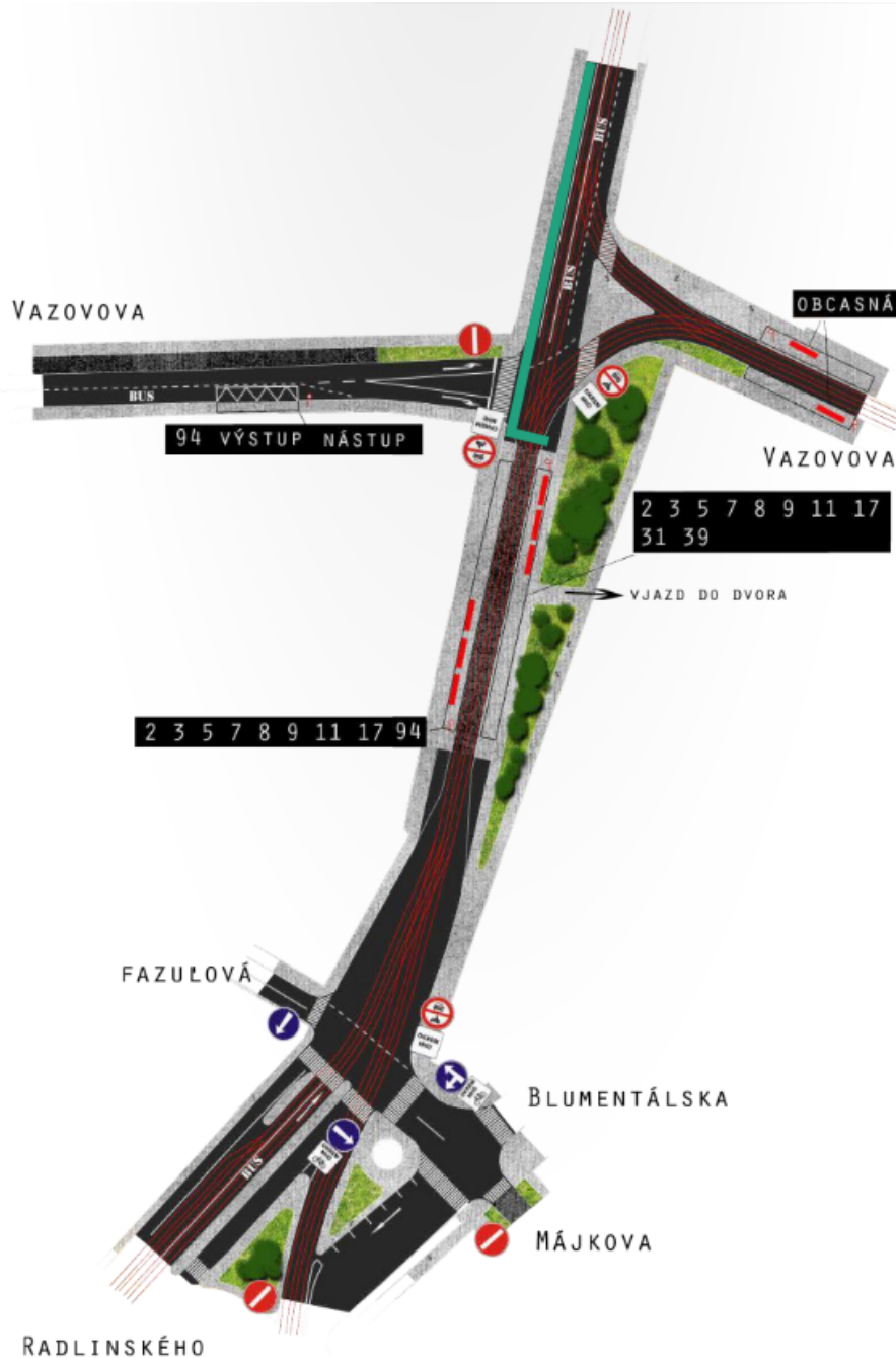
Obr. 1: Začiatok trasy zakreslený do návrhu Lepšej dopravy

Za terminálom (ešte v priestore bez IAD) navrhujeme prevedenie oboch smerov cyklotrasy na západnú stranu Radlinského ulice, doplnenie priečodu pre cyklistov cez vyústenie Vazovovej a vytvorenie obojsmernej cestičky pre cyklistov na úkor jazdného pruhu do centra až po Račianske mýto. Náhradná trasa pre motorové vozidlá bude viesť cez Mýtnu a Vazovovu.