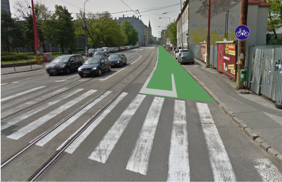
Obr. 2: Pohľad na navrhovanú cyklotrasu od Račianskeho mýto

Račianskym mýtom trasa prejde podľa návrhu Lepšej dopravy, teda najskôr paralelne s električkovou traťou až k električkovej zastávke a následne doľava popri priechode pre chodcov novým priechodom pre cyklistov.