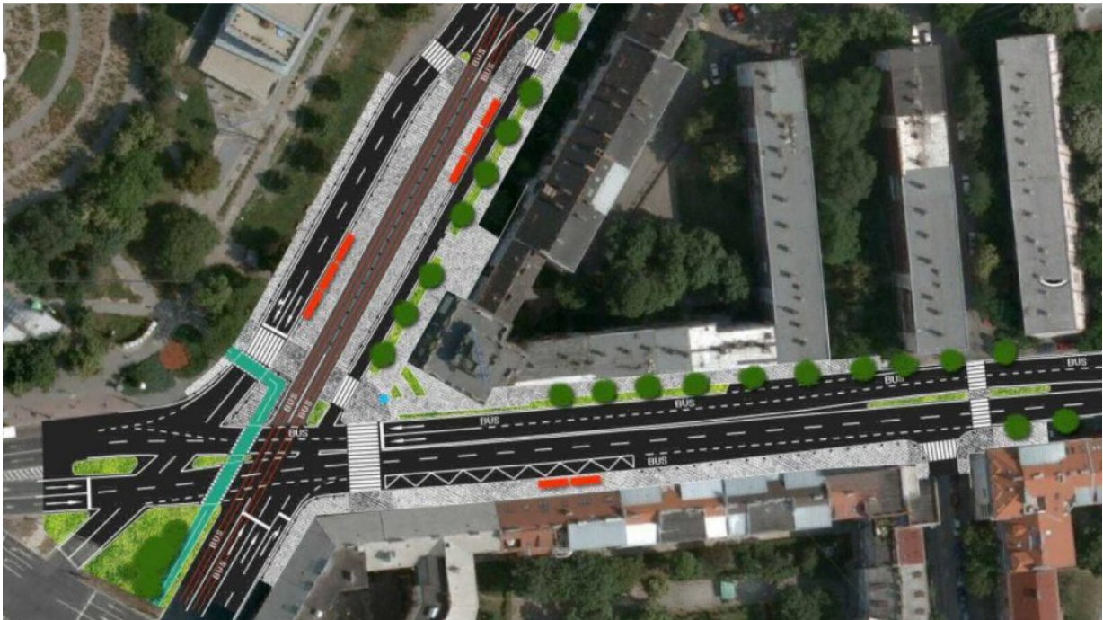
Obr. 3: Prechod Račianskym mýtom podľa návrhu Lepšej dopravy

Račianskym mýtom trasa prejde podľa návrhu Lepšej dopravy, teda najskôr paralelne s električkovou traťou až k električkovej zastávke a následne doľava popri priechode pre chodcov novým priechodom pre cyklistov.