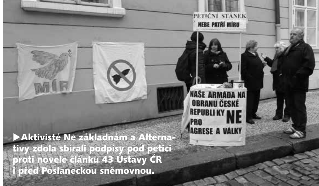
► Aktivisté Ne základnám a Alternativy zdola sbírali podpisy pod petici proti novele článku 43 Ústavy ČR i před Poslaneckou sněmovnou.