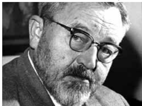
► Jan Werich